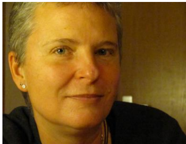
© Text und Bilder von Barbara Nikolaus

0160-92 67 68 02 barbara.nikolaus@t-online.de www.barbara-nikolaus.de