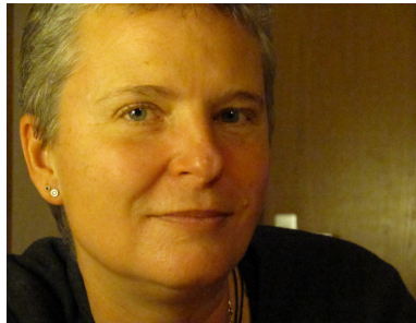
© Text und Bilder von Barbara Nikolaus

0160-92 67 68 02 barbara.nikolaus@t-online.de www.barbara-nikolaus.de